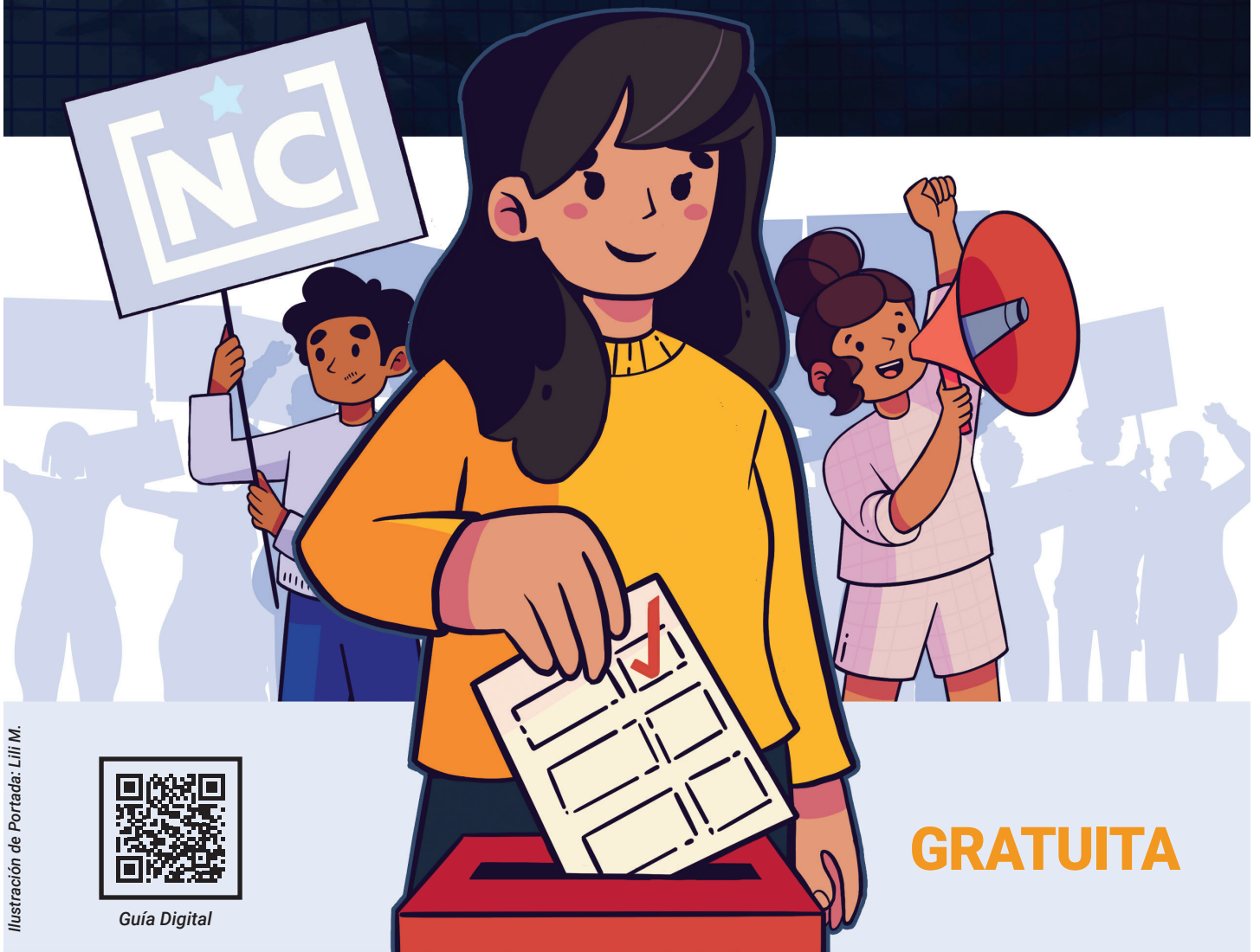
Ilustración de Portada: Lili M.